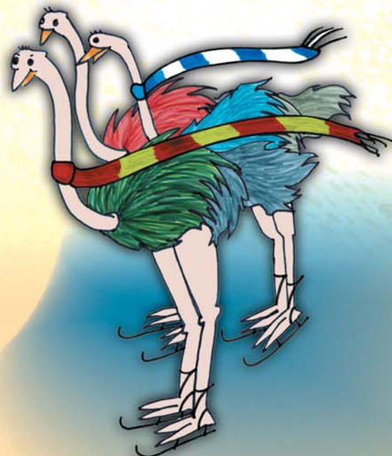
Illustration: Maryse Robarge